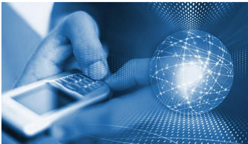
Средства коммуникации и общения