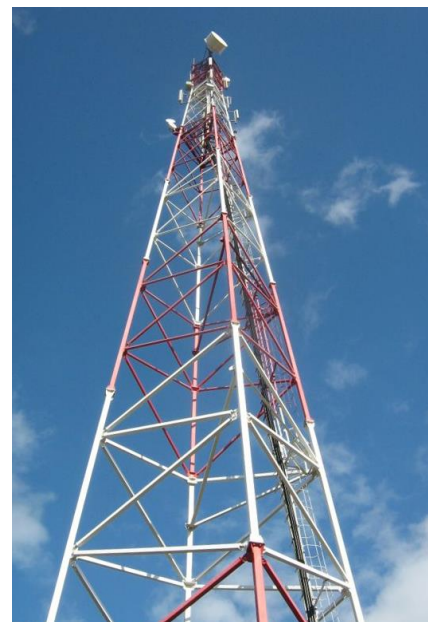
Средства передачи и приёма СМС и речевых сообщений