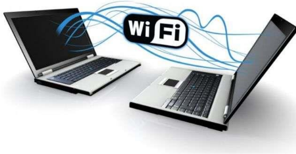
Средства беспроводной передачи данных Wi-Fi