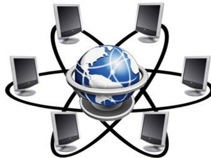
Глобальная сеть Интернет